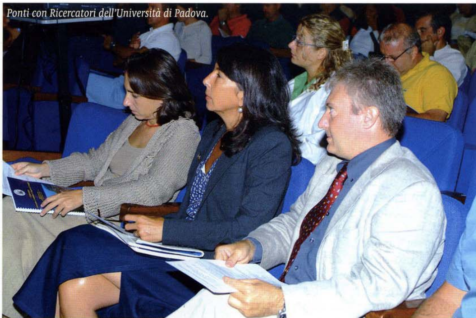
Ponti con Ricercatori dell'Università di Padova.

tratto di costa di particolare valenza, nel quale vengono effettuate circa sessantamila immersioni all'anno. Tunesi ha posto l'accento sugli aspetti economici, ricordando che la gestione di un'area marina protetta ha dei costi rilevanti, che non sempre sono completamente coperti dai contributi forniti dall'Amministrazione Pubblica. Alla risoluzione di questo problema, non solo italiano ma sentito a livello internazionale, possono concorrere anche i visitatori, prendendo esempio da Portofino, che ha istituito un contributo economico di tre euro ad immersione a fronte dell'utilizzo delle boe di ormeggio posizionate dall'ente gestore del parco. La subacquea ricreativa costituisce una componente strategica per il successo di un'area marina sog-