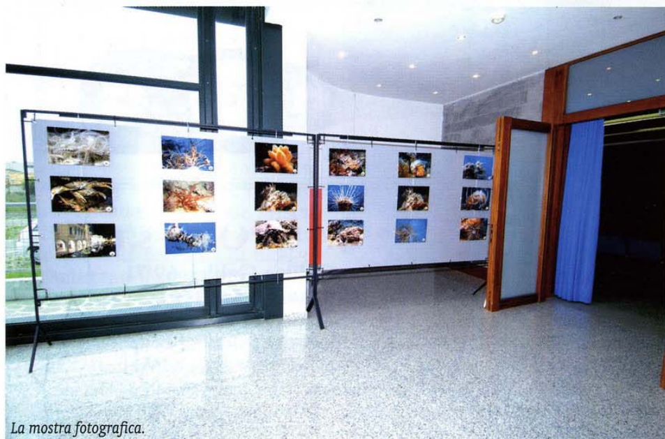
La mostra fotografica.