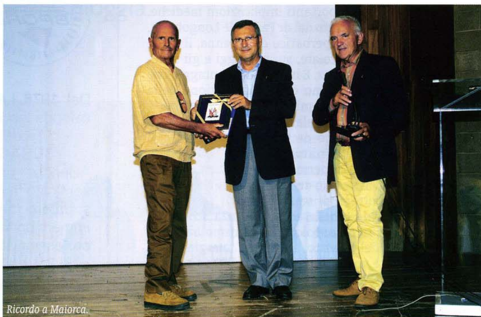
Ricordo a Maiorca.

Gli altri due temi del convegno riguardavano argomenti di grande attualità come la fruizione turistica subacquea nelle aree marine protette e la pesca sostenibile nelle medesime. La prof.ssa Maria Rasotto dell'Università di Padova ha posto l'attenzione sulla necessità che la gestione delle aree marine protette includa e disciplini i flussi d'uso, considerando gli eventuali conflitti. Proprio in funzione di queste esigenze, in diverse aree marine protette mediterranee sono state attuate, o sono in